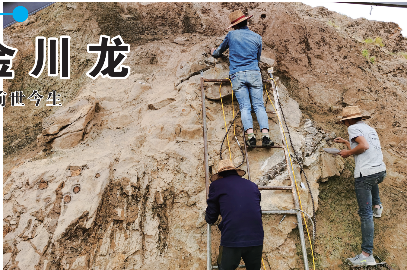
►古生物专家清理修复金川龙化石。